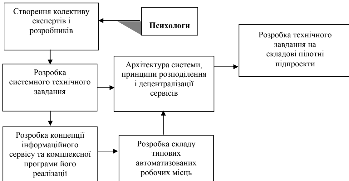
Рисунок 3 – Організаційні етапи технології розробки СПІ

Архітектура такого роду системи неодмінно повинна бути відкритою і з погляду підключення до неї нових користувачів, і з погляду сервісу, що безперервно поліпшується і розширюється, і змін топології і функцій захисту інформації.