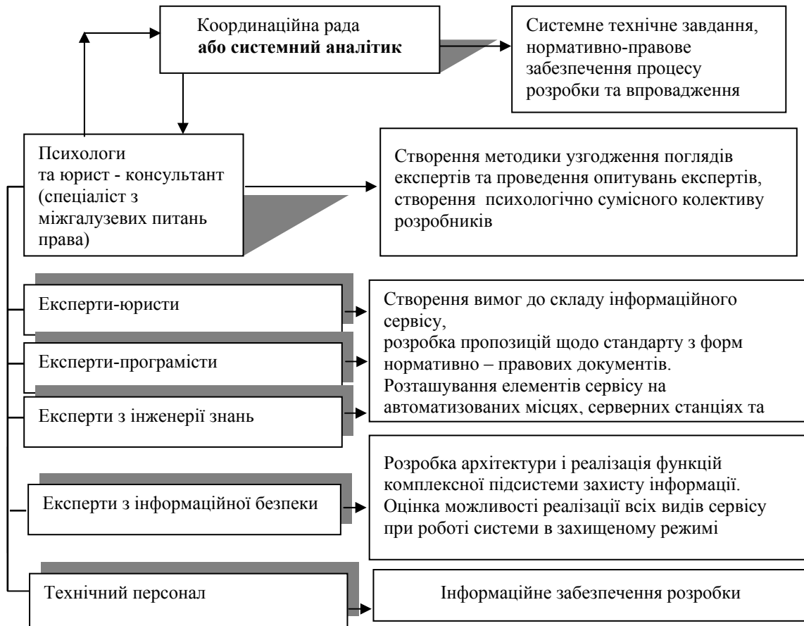
Рисунок 2 – Склад творчого колективу з розробки пілотного проекту СПІ

Друга задача повинна розв'язуватися спільно юристами, інформатиками і фахівцями з інженерії знань.