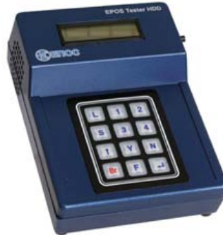
Рисунок 3 – Стенд для технического обслуживания жестких дисков

Опыт фирмы ЕПОС по ремонту жестких дисков и восстановлению информации позволил создать стенд для технического обслуживания жестких дисков (рис. 3).