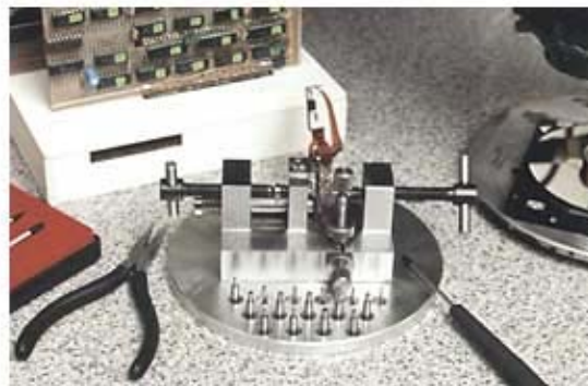
Рисунок 1 – Слева – рабочее место по ремонту дисков в чистой комнате, справа – прецизионная установка для замены головок

Тем не менее, в случае механических повреждений элементов, расположенных в камере жесткого диска, можно говорить только о восстановлении информации, но не о дальнейшей эксплуатации диска.