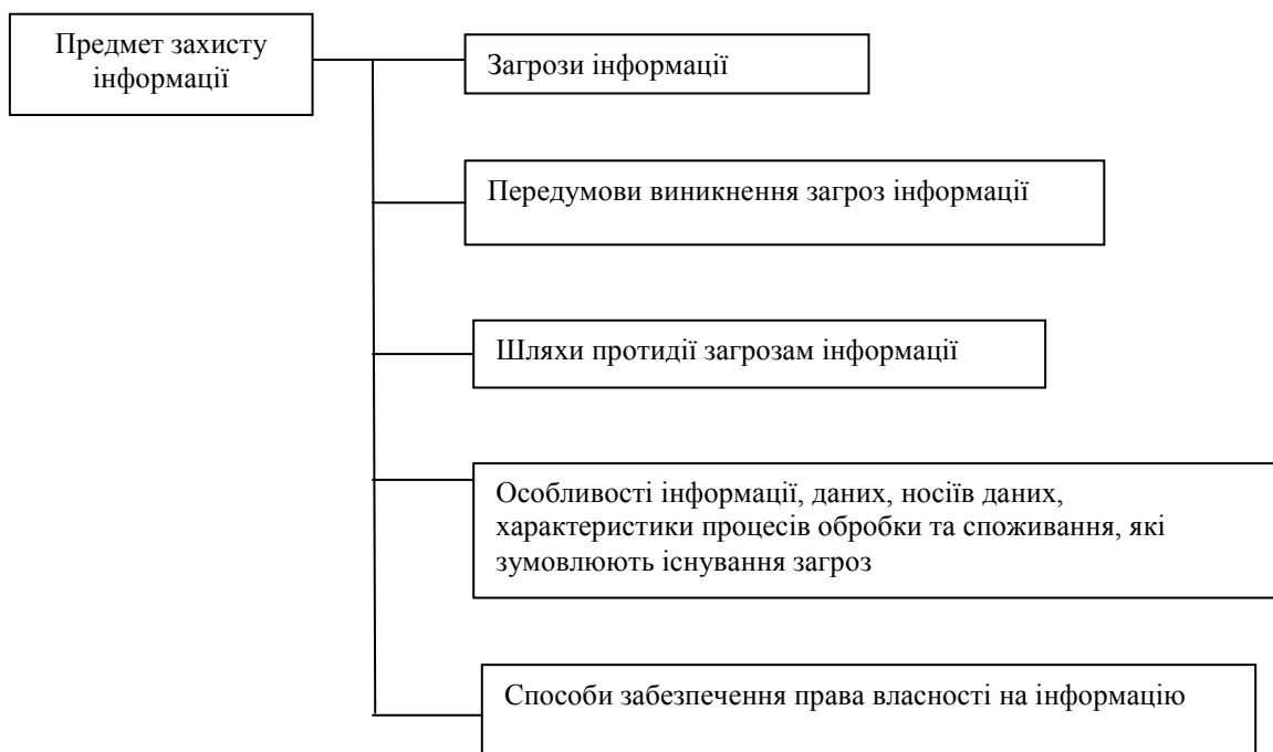
Рисунок 2 – Структура предмета захисту інформації

Відповідно, для захисту інформації можуть використовуватись ті ж самі методи, що й при створенні інформаційних технологій, комп'ютерних систем тощо. Це – методи системотехніки (математичне моделювання, фізичний або технічний експеримент), кібернетики (математичний експеримент, машинне моделювання, ймовірно-статистичні методи аналізу), теоретичної інформатики (математичне моделювання, соціологічний аналіз, метод аналогій, методи пошуку оптимальних рішень), а також методи юридичних наук (методи моделювання нормативно-правової бази, методи виявлення та дослідження правовідносин, що виникають між суб'єктами інформаційних процесів).